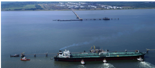
Ilustración 1: Tanques costeros e insulares almacenadores de refinería de la compañía WRG

En los estudios realizados para la compañía WRG fue analizada y evaluada mediante de simulaciones hidráulicas la sedimentación producida bajo distintas condiciones de construcción de los tanques costeros e insulares almacenadores de refinería de la WRG con el fin de determinar una variante de diseño.